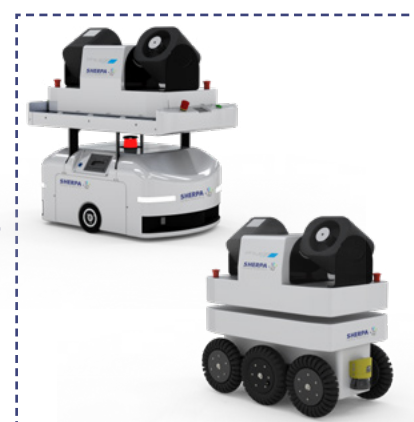
Solution de désinfection mobile