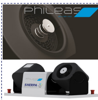
Diffusion par disque rotatif